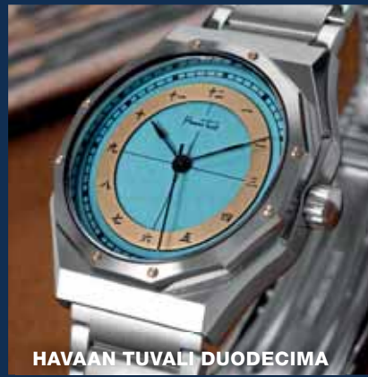
HAVAAN TUVALI DUODECIMA