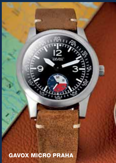
GAVOX MICRO PRAHA