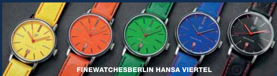
FINEWATCHESBERLIN HANSA VIERTEL