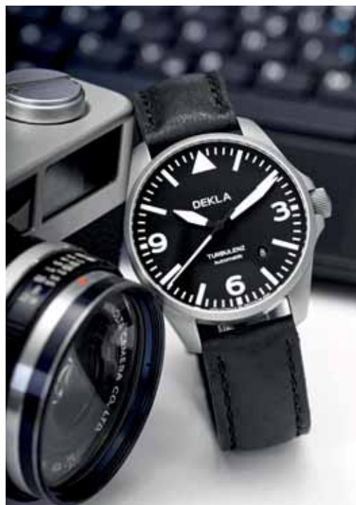
DEKLA TURBULENZ 42MM řadí stuttgartská značka mezi taktické hodinky. Cena 630 EUR.

Myslím si, že nebudu jediný, když na sebe prásknu, že jsem nejednou měl myš na tlačítku „koupit“, ale protože chyběla možnost si hodinky vyzkoušet, raději jsem