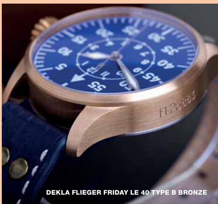
DEKLA FLIEGER FRIDAY LE 40 TYPE B BRONZE

si lze informace o existenci těchto malých značek a jejich nových počinech relativně snadno dohledat. Co už však bývá problém, je jejich dostupnost. Na rozdíl od zavedených společností totiž nemají mikro brandy (naprostá většina již z podstaty) vybudovaný žádný systém prodejců a prodejen," doplňuje Ondra.