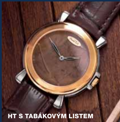
HT S TABÁKOVÝM LISTEM