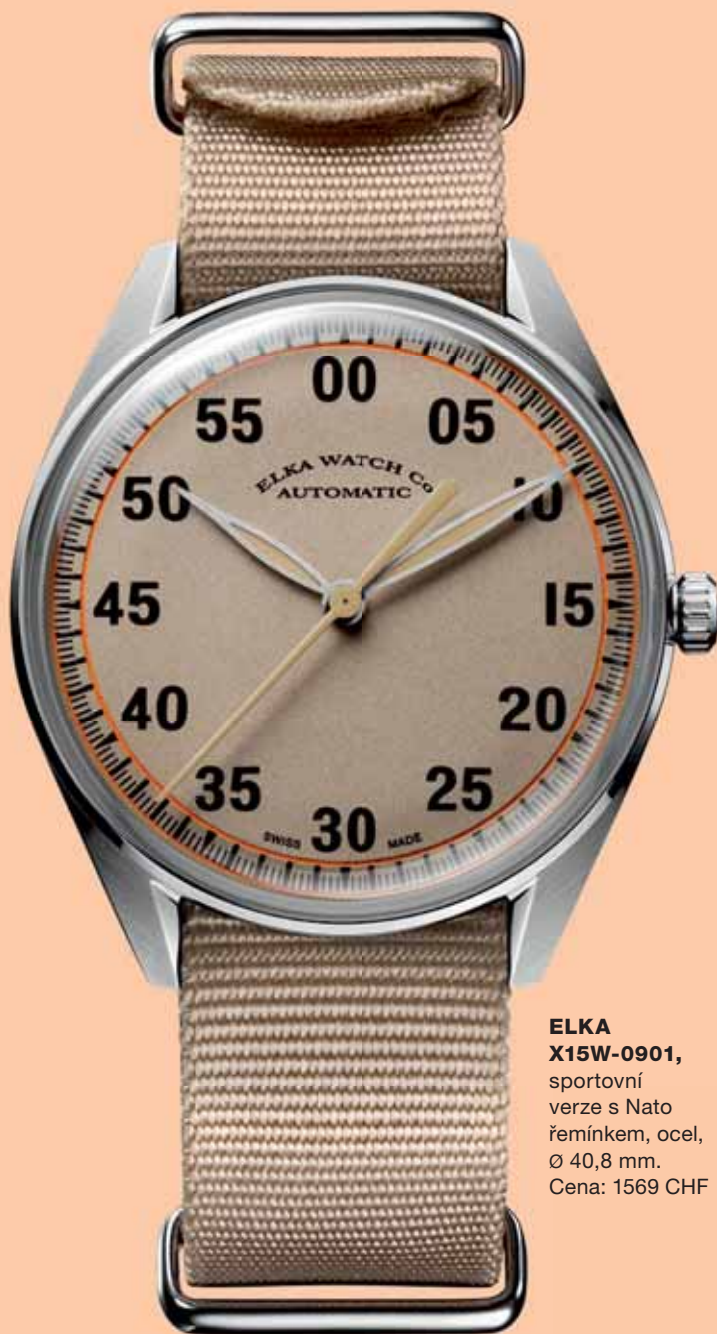
ELKA X15W-0901 , sportovní verze s Nato řemínkem, ocel, Ø 40,8 mm. Cena: 1569 CHF

Historie značky Elka se začala psát v roce 1913, kdy Edouard Louis Kiek se svým švagrem založili hodinářskou dílnu v Amsterdamu, později známou pod obchodní značkou ELKA (ta vznikla složením prvních písmen jména zakladatele a místa sídla firmy), v níž začali s výrobou vlastních hodinek. V roce 1949 firma expandovala na švýcarský trh. Do úspěšné expanze firmy zasáhla v 70. letech minulého století tzv. quartzová krize a značka jako taková zmizela ze světa. Na její dávnou slávu se rozhodl v roce 2022 navázat nový majitel, matador hodinářského průmyslu pan Hakim El Kadiri, kterému se (bez jakéhokoli vztahu ke značce) již jako malému chlapci přezdívalo Elka.