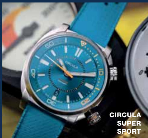
CIRCULA SUPER SPORT

Rodinná firma Circula má kořeny v Pforzheimu, v jednom z nejstarších německých klenotnických a hodinářských center, kde již více než 60 let vyrábí osobitě vypadající, přesné, spolehlivé a odolné hodinky.