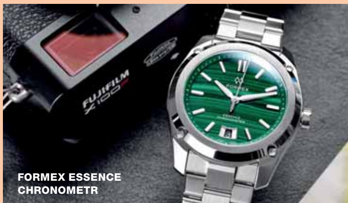
FORMEX ESSENCE CHRONOMETR

Formex je nezávislý švýcarský výrobce hodinek se sídlem v Biel/Bienne. Firma byla založená v roce 1999. Hodinky této značky představují spojení high-tech materiálů se spolehlivými švýcarskými strojkami.